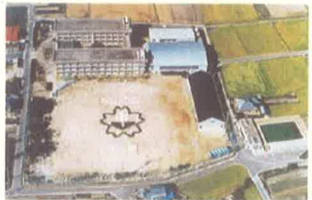
1995年の北伊予中学校