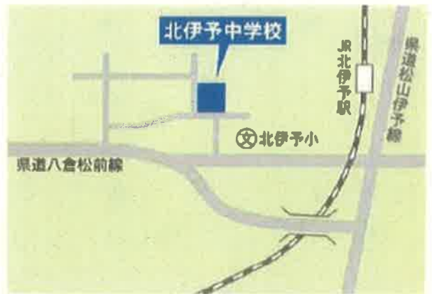
北伊予中学校の場所